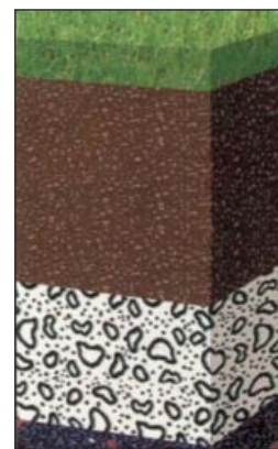
Aufbaubeispiel für Golfgreens: