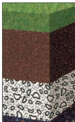
Schichtaufbau einer KRESCAT-Rasenfläche nach DIN 18035, Teil 4: Drainschicht-Bauweise